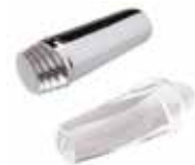
Manillas acrílicas y cromadas