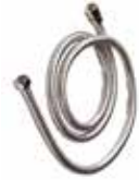
Manguera Ducha Teléfono 150 cm COD. SG0049550001BO